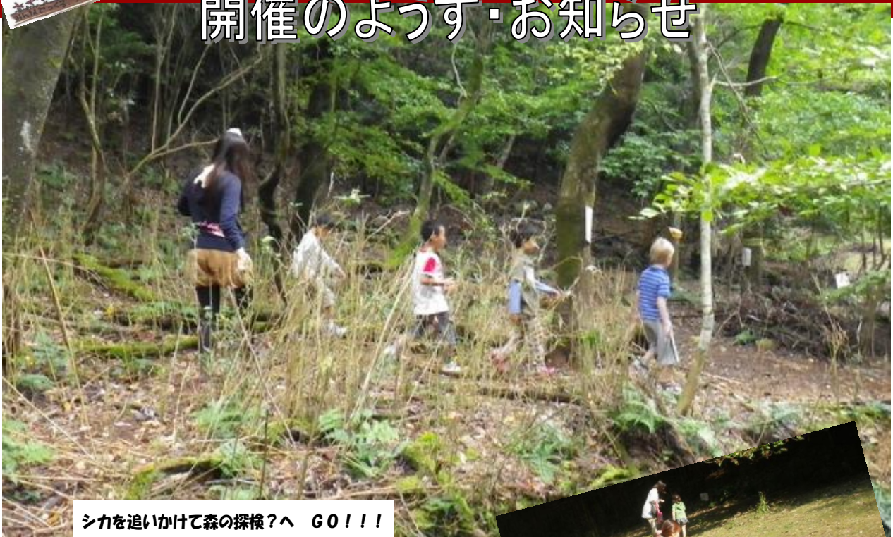
シカを追いかけて森の探検?へ GO!!!!