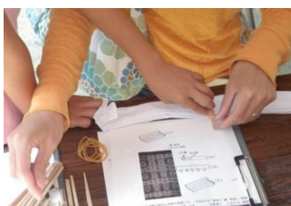
見本をみながら、柄を布に入れて、煮込みます！