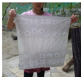
こんな色に染まりました

お母さんが悔しそうでした★ あらわれまし こんなステキな柄が を繰り返して・・・ 煮て、洗って、媒染に浸して・・・