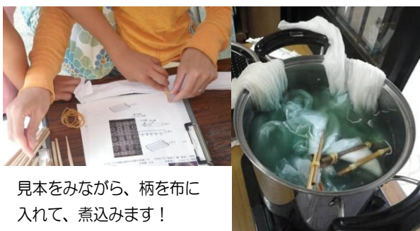
見本をみながら、柄を布に入れて、煮込みます！

お母さんが悔しそうでした★ あらわれまし こんなステキな柄が を繰り返して・・・ 煮て、洗って、媒染に浸して・・・