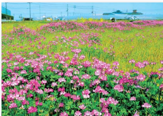
「花摘む女」 城田 祥男 久御山町(久世郡)