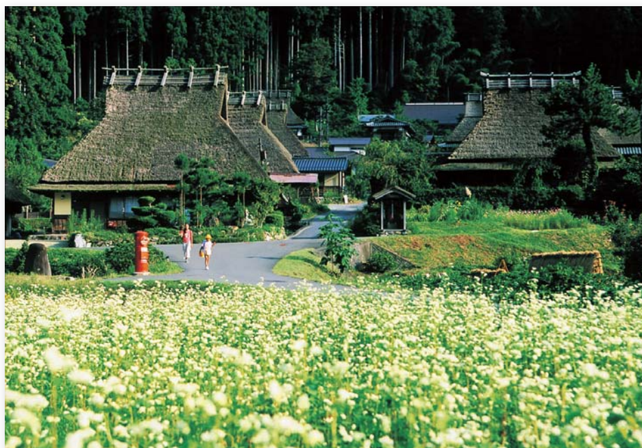
「初秋の里」 井上 敏和 美山町(南丹市)