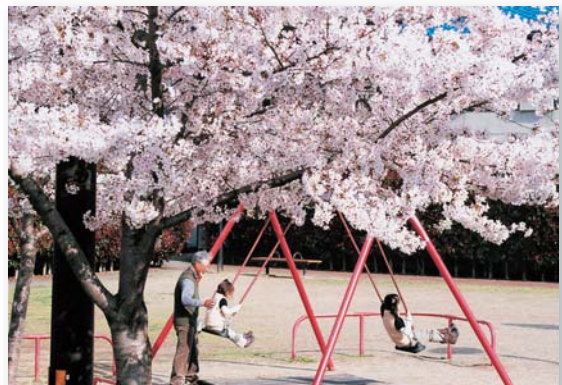
「花よりブランコ」 米津 惟 深田川公園(向日市)