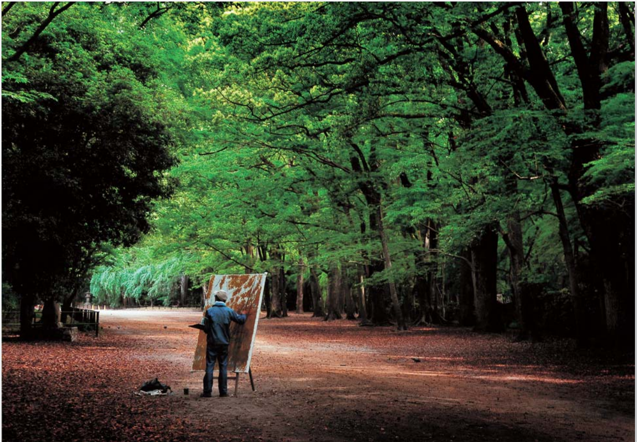
「新緑の頃」 山下 文行