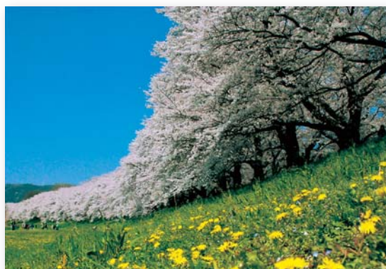
「巨大な壁」 西橋 弘 背割り堤桜(八幡市)