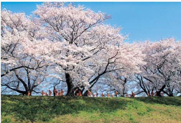
「桜日和」 谷 八紘 淀川河川公園(八幡市)