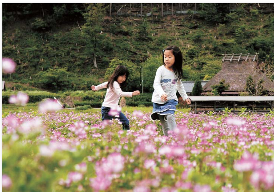
「山里の春」 水野 利彦 美山町(南丹市)