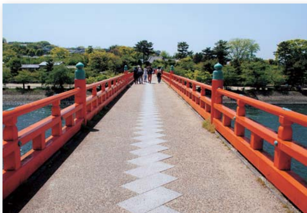
「対称の美」 大田 嘉治 宇治川(宇治市)