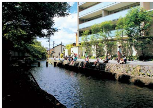
「町中のオアシス」 立山 明宏 白川(京都市左京区)