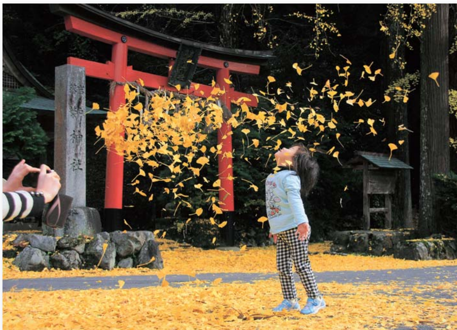
「戯れ」 芝原 康夫 落葉神社(京都市北区)